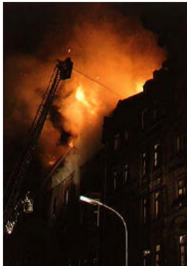
Brandursache: defekter Heizlüfter