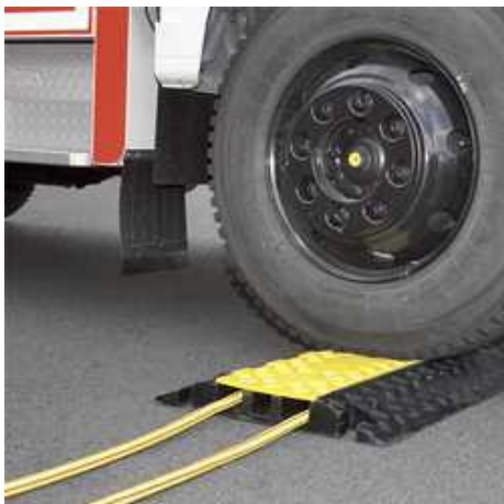
Abb. 5: Beispiel für eine überfahrbare Kabelbrücke

Sofern Leitungen über Feuerwehrezufahrten gespannt werden, ist eine lichte Durchfahrts- höhe von mind. 3,50 Meter einzuhalten. Im Verlauf von Fahrwegen sind überfahrbare Kabelbrücken zu verwenden.