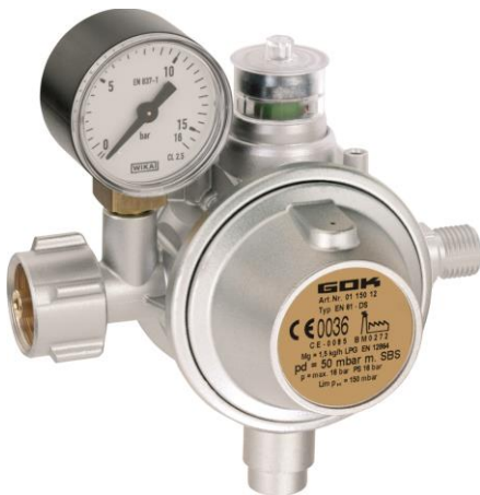
Abb. 12: Zweistufiges Druckregelgerät für den Gewerbebereich mit Überdrucksicherheits-einrichtung, Sichtanzeige und integrierter Schlauchbruchsicherung