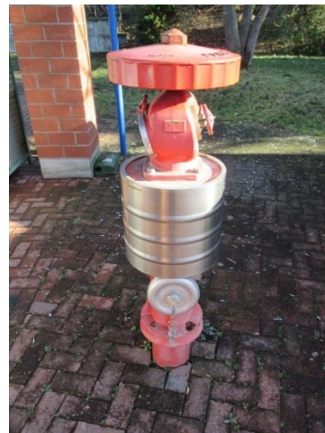
Abb. 8: Überflurhydrant