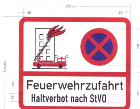
Abb. 1: Beschilderung einer Feuerwehrzufahrt

Die im Rahmen der Veranstaltungsgenehmigung festgelegten Flächen für die Feuerwehr (Zugänge, Feuerwehrzufahrten, Aufstellflächen, Bewegungsflächen) sowie Flucht- und Rettungswege sind im gesamten Veranstaltungsbereich während der gesamten Zeit der Nutzung von jeglichen Aufbauten freizuhalten. Die bestehenden Zugänge und mit Hinweisschildern gekennzeichneten Feuerwehrzufahrten zu Gebäuden im Veranstaltungsbereich dürfen nicht eingeschränkt werden.