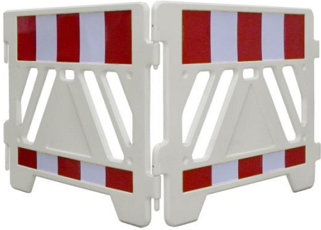
Abb. 6: Beispiel für eine geeignete Absperrvorrichtung

Anzahl und Anordnung von Kabeln, Schläuchen und ähnlichen Leitungen, welche oberhalb von notwendigen Feuerwehr- und Aufstellflächen angebracht werden sollen, sind frühzeitig im Einvernehmen mit der Feuerwehr Mainz abzustimmen.