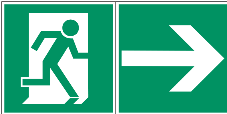
Abb. 3: Beispiel für eine Rettungswegbeschilderung nach ASR A1.3:2013/EN ISO 7010

Aus allen Aufenthaltsbereichen sind grundsätzlich ausreichend bemessene Flucht- und Rettungswege vorzusehen. Diese Flucht- und Rettungswege müssen – soweit sie nicht klar erkennbar sind – gut sichtbar bis ins Freie oder in einen gesicherten Bereich gekennzeichnet werden, z.B. durch Schilder und/oder Transparente mit weißer Schrift auf grünem Grund (analog ASR A1.3:2013/EN ISO 7010).