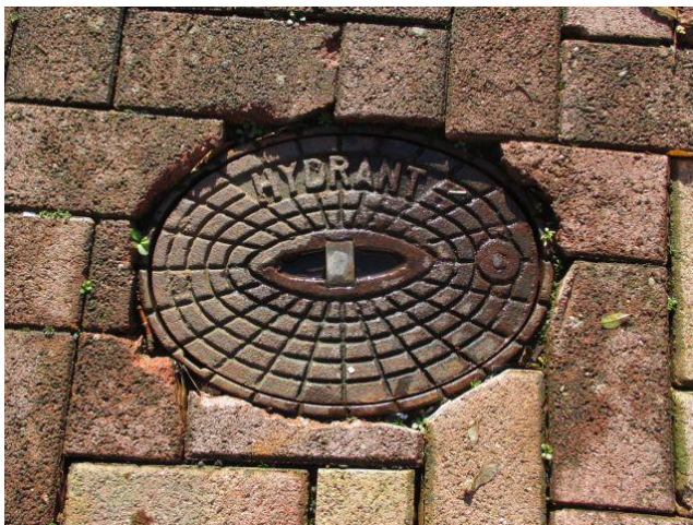
Abb. 7: Unterflurhydrant

Löschwasserentnahmeeinrichtungen (Über- und Unterflurhydranten) sind einschließlich ihrer Kennzeichnungen von Aufbauten oder Lagerungen im Umkreis von 1 Meter freizuhalten und müssen jederzeit zugänglich sein.