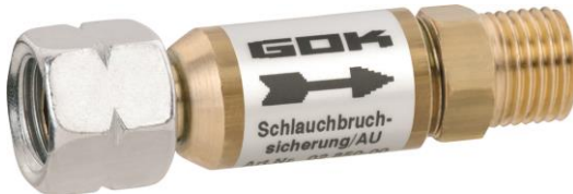
Abb. 11: Schlauchbruchsicherung