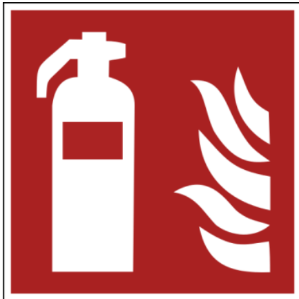
Abb. 4: Brandschutzzeichen „Feuerlöscher“ nach ASRA1.3:2013/EN ISO 7010