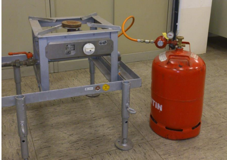
Abb. 9: Flüssiggasanlage mit Versorgungsanlage und Verbrauchsanlage